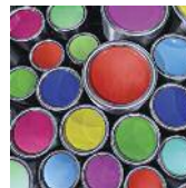
페인트 및 코팅