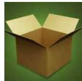
인쇄되지 않은 포장상자